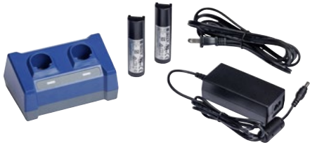
Das V1100-Set umfasst ein Reserve-Ladegerät, zwei Akkus, einen AC-Adapter und ein Netzkabel