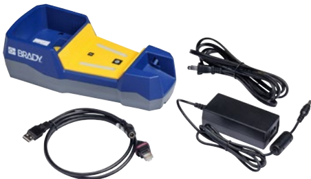
Das V1300-Set umfasst Basisstation, AC-Adapter, USB-Kabel und Netzkabel