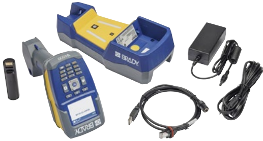
Das V4500-Set umfasst Lesegerät, Basisstation, Akku, AC-Adapter, USB-Kabel und Netzkabel